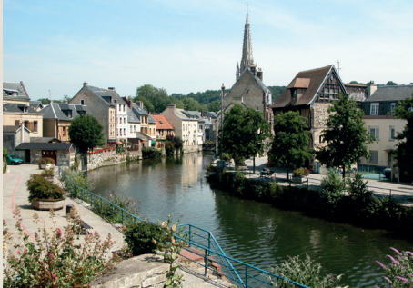
La Lézarde, Harfleur