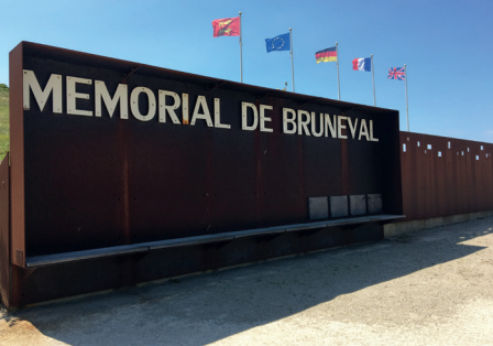
Mémorial de Bruneval, Saint-Jouin-Bruneval