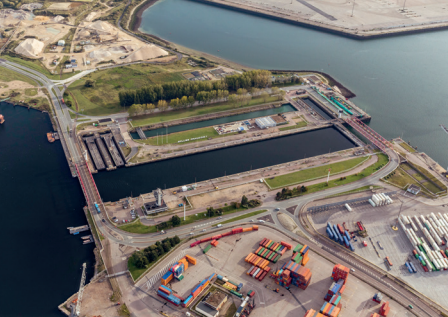
Ecluse François 1 er , Le Havre