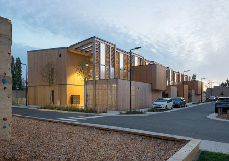
Résidence Les Vernelles, Le Havre