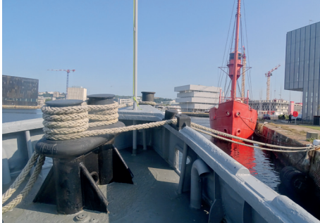
Bateaux classés monuments historiques, accostés quai Renaud, Le Havre