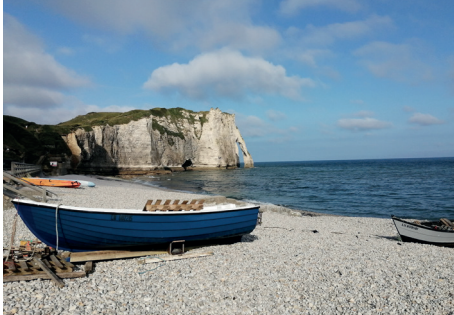
Le Perrey, Étretat

📍 Le quartier des Neiges, une île dans la ville, Le Havre Dimanche 16 janvier et samedi 5 février, 14 h 30 Descriptif p. 11