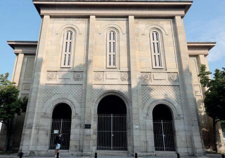
Temple protestant, Le Havre