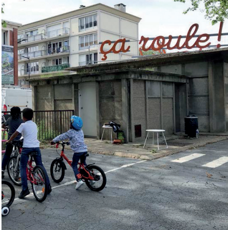
GENIUS 2021, Le Havre