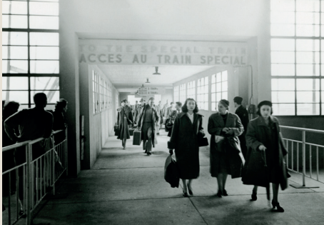
Arrivée des passagers du train dans la gare maritime du Havre