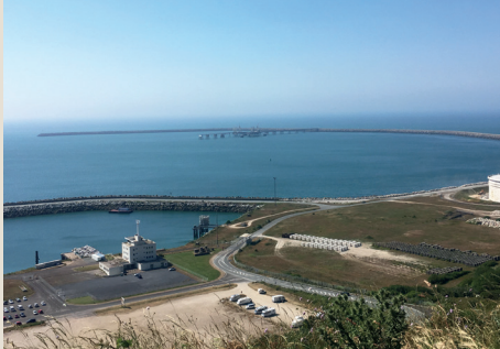
Port d'Antifer, Saint-Jouin-Bruneval

⌚ 45 min - 10 € / 8 € (sous-réserve des conditions météorologiques - copie de la pièce d'identité à fournir à la réservation / photos interdites)