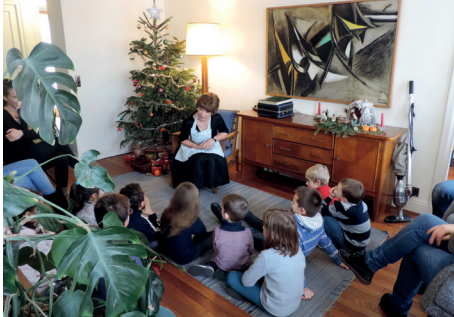
Contes de Noël dans l'Appartement témoin Perret, Le Havre