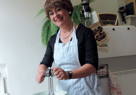
À table avec Madame !, Le Havre