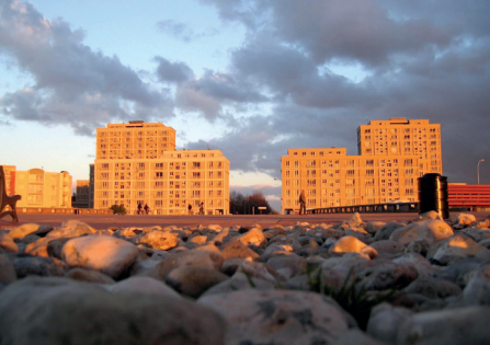
Patrimoine à vélo, Le Havre