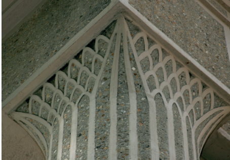
Immeuble Friez & Foch, Le Havre

Visite limitée à la salle des cartes en cas de météo défavorable.