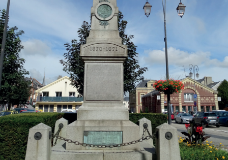
Monument aux morts de la guerre de 1870, Saint-Romain-de-Colbosc