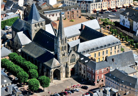
Église abbatiale, Montivilliers

*Détail de la tarification Pays d'art et d'histoire, voir Mode d'emploi p. 33