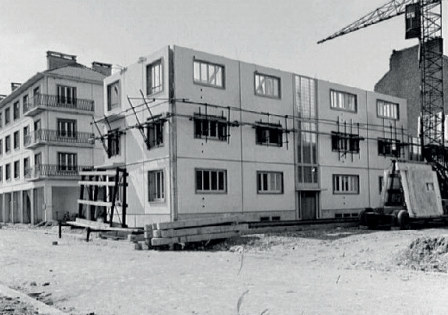
Chantier de l'îlot N17, Le Havre