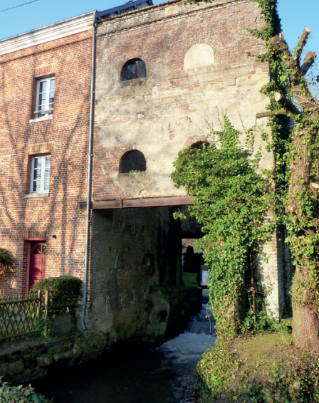
Moulin de la Drille, Épouville