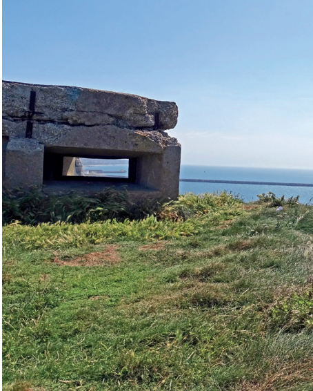
Bunker, La Poterie-Cap-d'Antifer

Après l'audacieuse opération Biting et d'autres actions alliées le long de la côte atlantique, les Allemands se lancent à partir de mars 1942 dans l'élaboration d'une muraille de défense réputée imprenable de la Norvège à la frontière espagnole pour empêcher tout débarquement en zone occupée. Dans ce dispositif, les ports occupent une place stratégique, surtout ceux situés sur les côtes de la Manche. Le port du Havre fait alors l'objet de gigantesques travaux visant à l'ériger en forteresse inexpugnable. Ce patrimoine militaire, encore largement visible aujourd'hui (bunkers, casemates d'artillerie, stations radar, abris...), témoigne du plus grand projet de fortification jamais élaboré en Europe. C'est cette histoire qu'évoque l'exposition à travers photos, objets, plans, maquettes et documents.