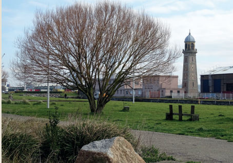
Cloche des docks et jardin fluvial, Le Havre