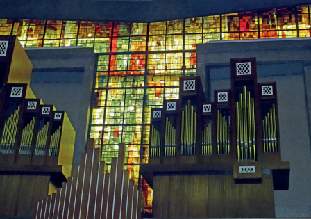
Eglise Saint-Michel, Le Havre