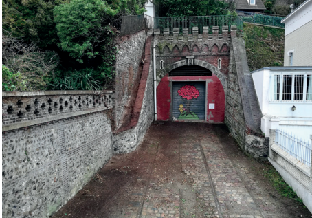
Tunnel Sainte-Marie, Le Havre