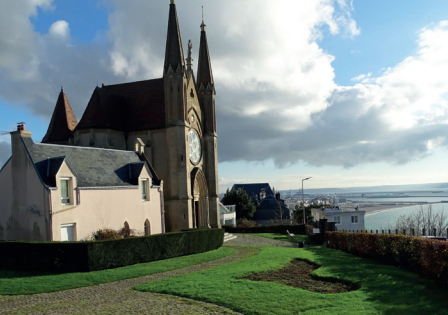
Notre-Dame des Flots, Sainte-Adresse