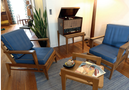
Appartement témoin Perret, Le Havre